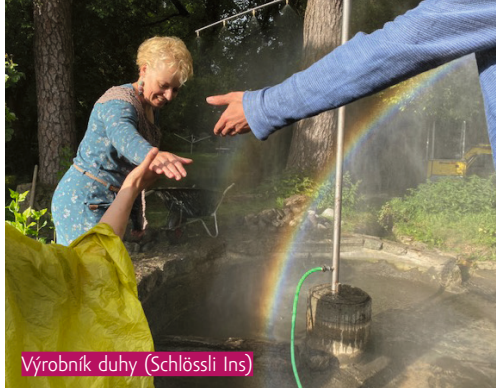
Výrobník duhy (Schlössli Ins)