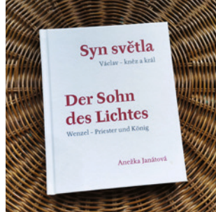
Dvojazyčně vydaná divadelní hra Anežky Janátové o sv. Václavovi