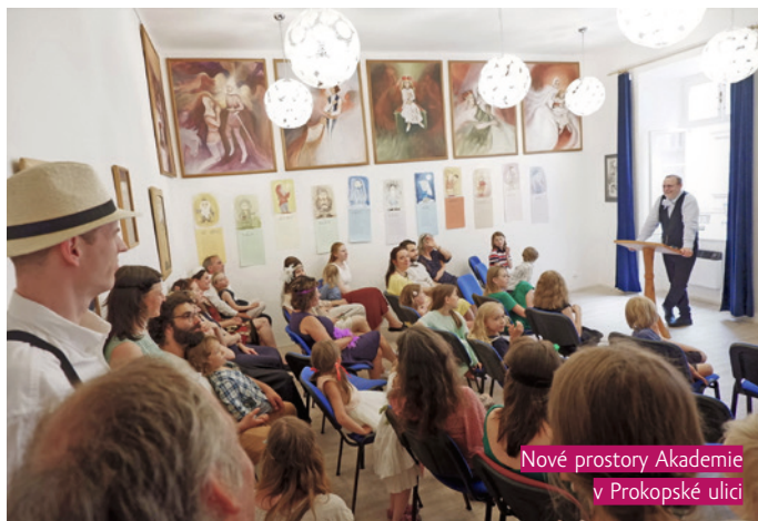
Nové prostory Akademie v Prokopské ulici