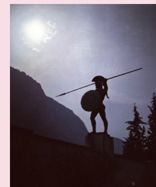
Studijní cesta po Řecku