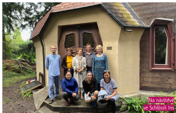
Na návštěvě ve Schlössli Ins