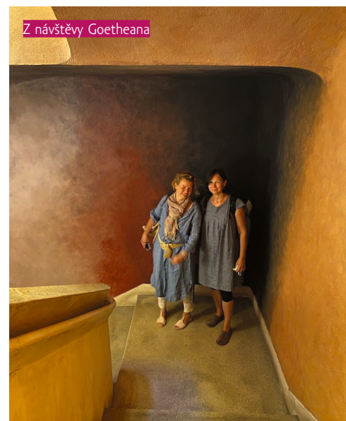
Z návštěvy Goetheana

kulturních epoch do berlínského Pergamon Museum, kde se v rámci stálé výstavy mohli s kulturními epochami potkat, a i v rámci umělecké tvorby se jim přiblížit.