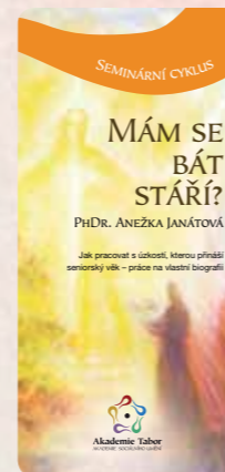
Jak pracovat s úzkostí, kterou přináší seniorský věk – práce na vlastní biografii