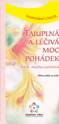
Věříme ještě na duši?