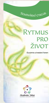
Eurytmie a kreslení forem